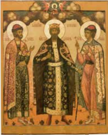
Святые благоверные князья Владимир, Борис и Глеб. 1670-е Государственный Ростово-Ярославский архитектурно-художественный музей-заповедник

Князья Борис и Глеб, добровольно отказавшиеся от власти и вероломно убитые своим братом Святополком, – первые русские святые. Креститель Руси князь Владимир был канонизирован позднее. Первоначально он характеризовался как отец святых братьев, то есть на него распространялась святость сыновей. Во главе с Владимиром Борис и Глеб почитались как защитники и покровители своего рода, а тем самым и всей земли, управляемой этим родом. Особое место в пантеоне русской святости Владимир занял в XVI веке. В Степенной книге царского родословия имя Василий, данное князю при крещении, истолковывалось как царский титул, а равноапостольный подвиг Владимира уподоблен подвигу первого христианского императора Константина. В Москве день его памяти праздновался неизменно и знаменовался большим трезвоном и благовестом.