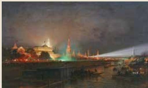
Боголюбов Алексей Петрович Иллюминация Кремля. 1883 Омский областной музей изобразительных искусств имени М.А. Врубеля

Александр III (1845–1894) – с 1881 года император Всероссийский, царь Польский и Великий князь Финляндский, сын Александра II, отец последнего российского монарха Николая II. В его царствование Россия не вела ни одной войны. За это монарх получил официальное прозвание Миротворец.