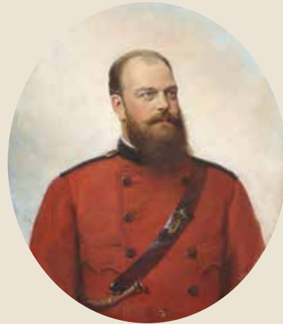
Корзухин Алексей Иванович Портрет императора Александра III. 1883 Приморская государственная картинная галерея

Князья Борис и Глеб, добровольно отказавшиеся от власти и вероломно убитые своим братом Святополком, – первые русские святые. Креститель Руси князь Владимир был канонизирован позднее. Первоначально он характеризовался как отец святых братьев, то есть на него распространялась святость сыновей. Во главе с Владимиром Борис и Глеб почитались как защитники и покровители своего рода, а тем самым и всей земли, управляемой этим родом. Особое место в пантеоне русской святости Владимир занял в XVI веке. В Степенной книге царского родословия имя Василий, данное князю при крещении, истолковывалось как царский титул, а равноапостольный подвиг Владимира уподоблен подвигу первого христианского императора Константина. В Москве день его памяти праздновался неизменно и знаменовался большим трезвоном и благовестом.